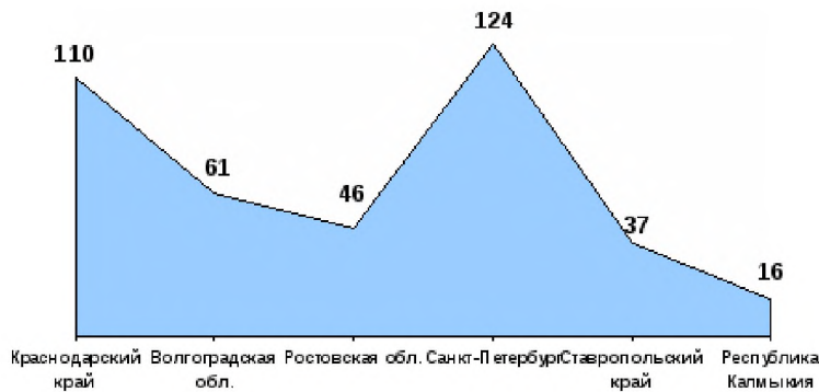
Рисунок 1 – Сведения о количестве учреждений социального обслуживания семьи и детей