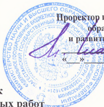
График защиты курсовых работ обучающихся направления 38.03.01 «Экономика» (уровень бакалавриата) филиала ДГУ в г. Хасавюрте Форма обучения очная 2024-2025 учебный год